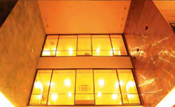
BAY SIDE square KAIKE HOTEL