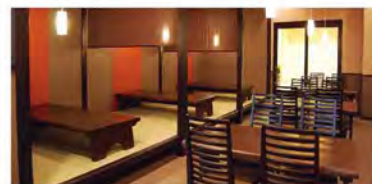
창작 일식 슈